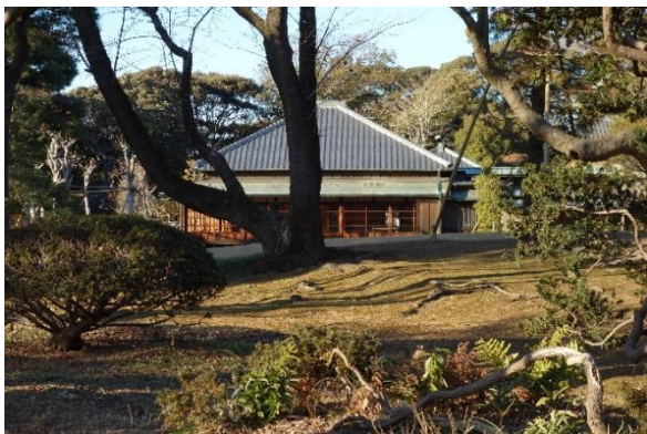
品のある佇まいの戸定邸