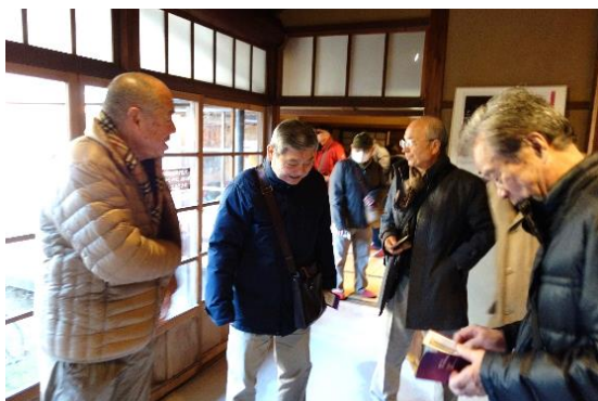
ガラス窓が多用されており明るい