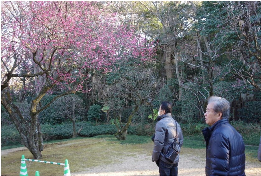
ここは梅園、早咲きの梅が咲いています