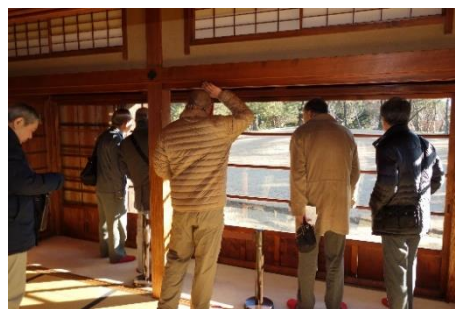
室内から庭園を眺める