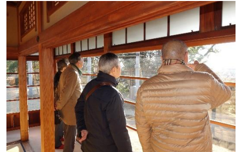
慶喜公も眺めていた景色