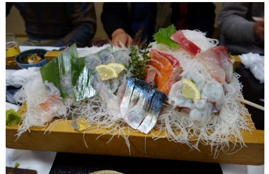
生きのいい刺身盛り合わせ