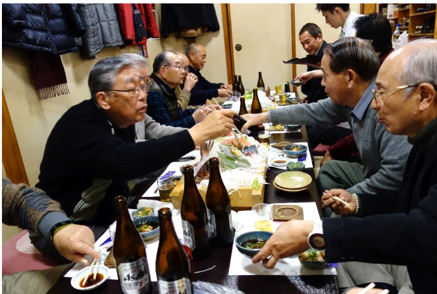
お待ちかね新年会の始まり始まり