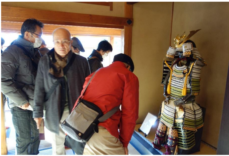
慶喜公の鎧（レプリカ）