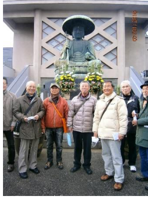
東禅寺(江戸六地藏)