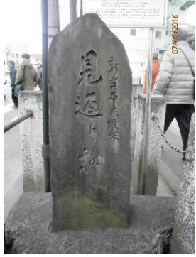
吉原出口にある見返り柳