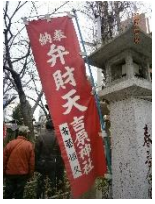
千束公園の遊女慰霊碑