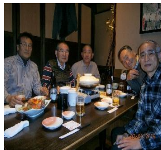
はなの舞浅草雷門店(26名)