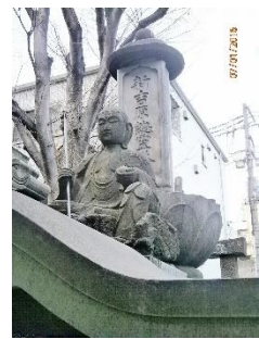
遊女が投げ込まれた墓