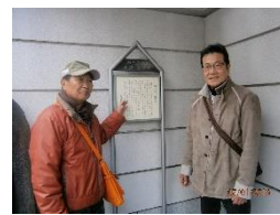
投げ込み寺の案内