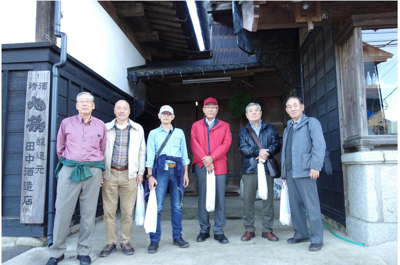
最終目的地の酒蔵前でお土産を下げて嬉しいで～す