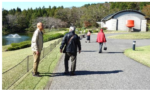
遠くにはすでに赤い芸術品が