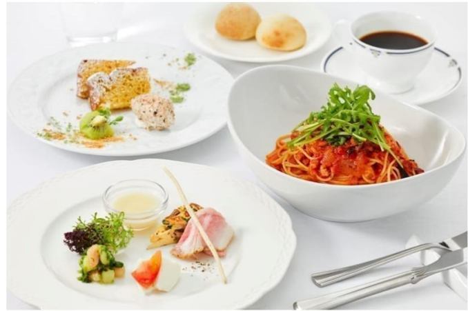
素晴らしい絵画や彫刻を堪能した後はお待ちかねランチタイム ベルヴェデーレのランチメニュー