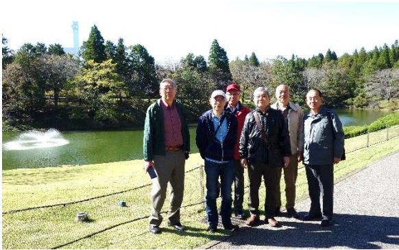
スタートの川村美術館の池と噴水