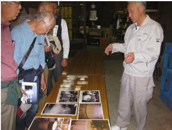
社長さん自ら熱心に酒つくりを説明この後現場を見学