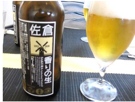
本日のオードブルと佐倉の地ビール 美味かった。この後のパスタとデザートは写真に無く胃の記憶に