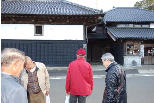
酒蔵到着 真新しい杉玉が新酒のお知らせ