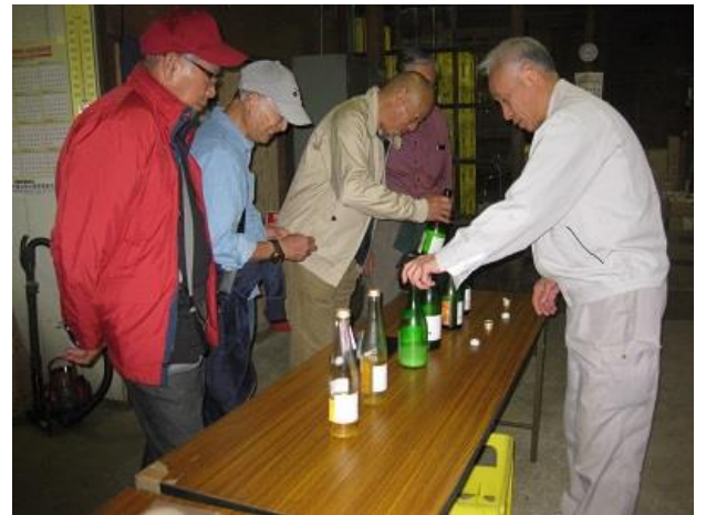
お待ちかねの利き酒 一通り頂きました