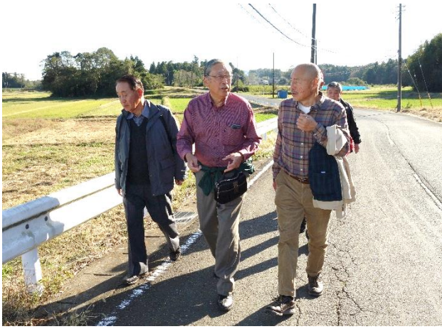
満腹の腹ごなし 酒蔵まで30分テクテク