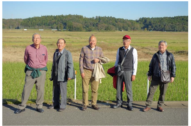
のどかな里山風景の中 いい散歩です