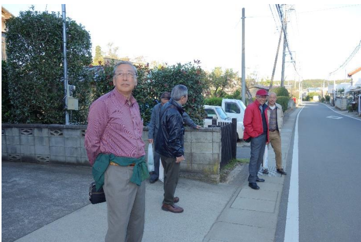
名残惜し気にバスを待ち、帰路につきます