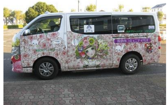
最後は愛想のいいお姉さんが運転するメルヘンバスで