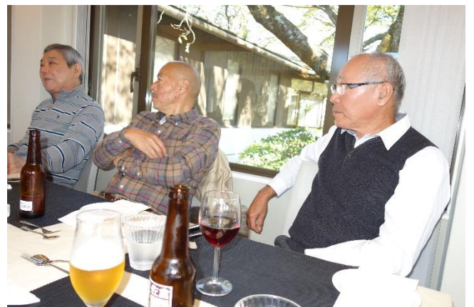
たっぷりの時間をとったランチを食べながらの歓談