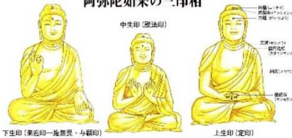
下生印 (東面印 - 施無畏・与願印)