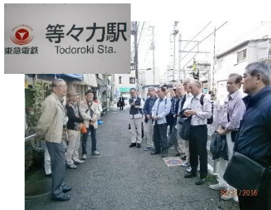
等々力駅 Todoroki Sta.