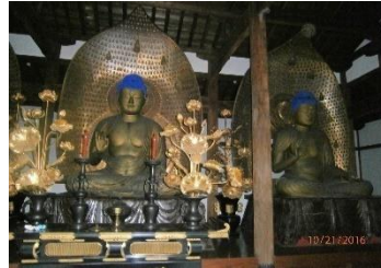
阿弥陀如来の三印相