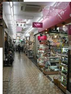
自由が丘デパート1F