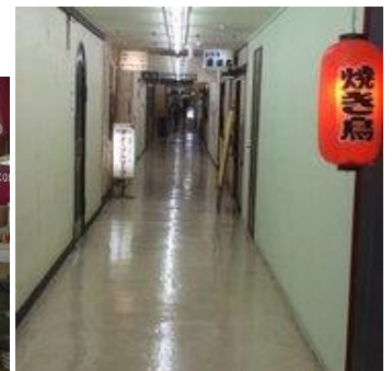
自由が丘デパート3F 焼き鳥美味しかった